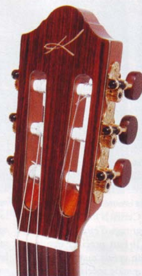
La tête reçoit un placage en palissandre affublé du logo spaghetti de la marque bulgare.

La Fiesta appartient à la série Artist, soit le haut du panier parmi les quatre gammes que propose le fabricant européen. Déclinée en deux versions, avec table en red cedar (référence FC) ou en épicea (FS), la Fiesta est une guitare classique qui répond aux canons du genre, sans fausse note. On retrouve ainsi les bois traditionnellement utilisés dans le domaine des guitares de qualité (notamment du palissandre des Indes ou du cèdre du Honduras). Revendiquant un montage « à la